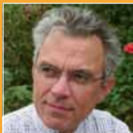
par Véronique NGUYEN Professeur affiliée, HEC Associée, Finexent